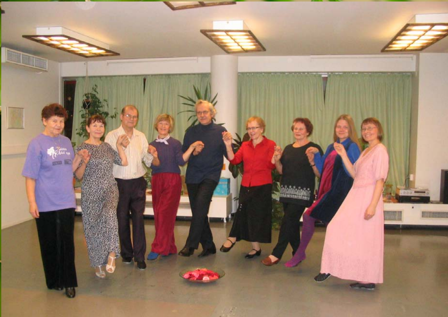
Eheyttävän tanssin ryhmä