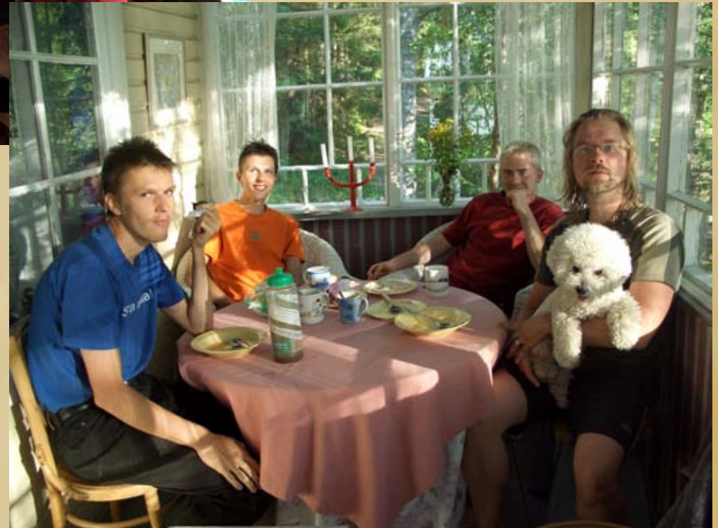
Virkistyspäivä Kirsin mökillä 2006