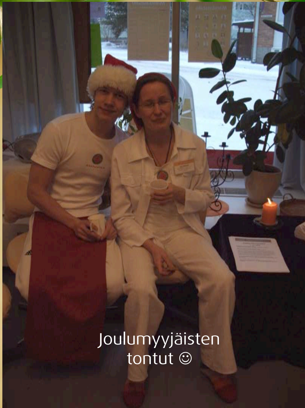
Joulumyyjäisten tontut 😊