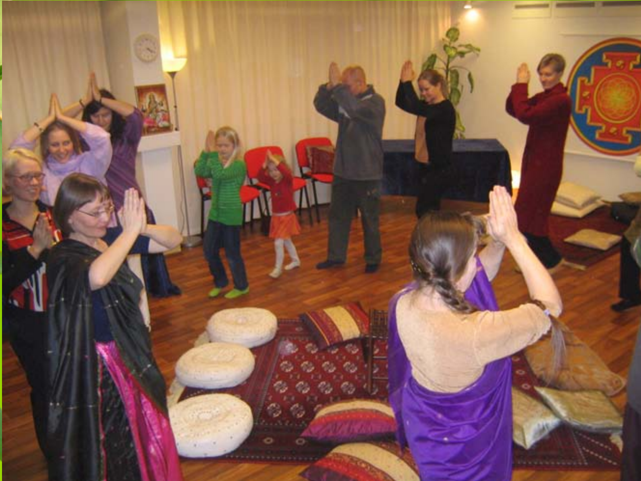
Intialainen ilta marraskuussa 2007