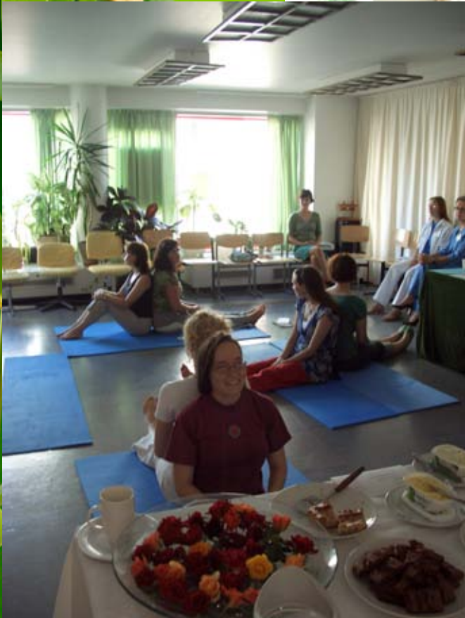
Avoimet ovet 2006