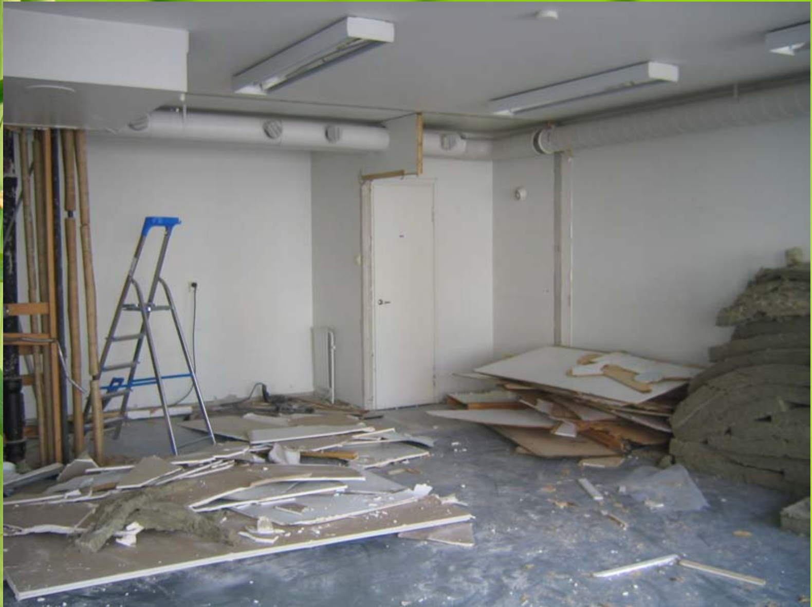
Hoituhuone remontin alkaessa.