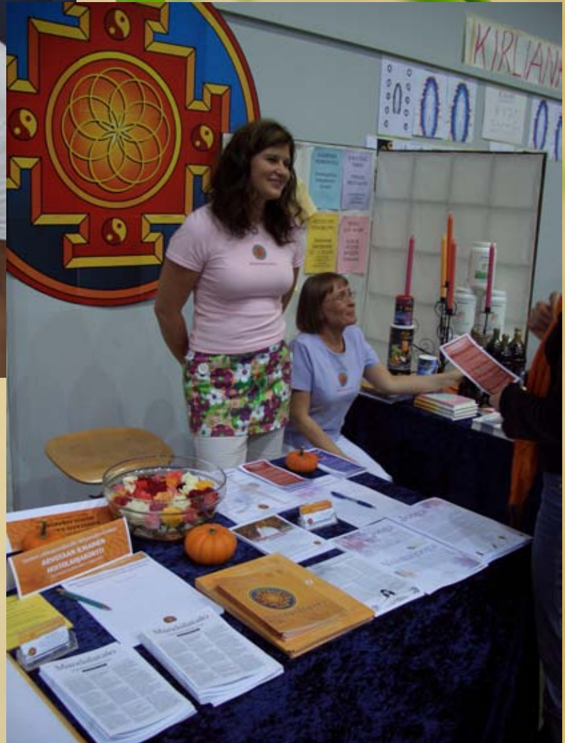
Hyvän Olon messut 2005