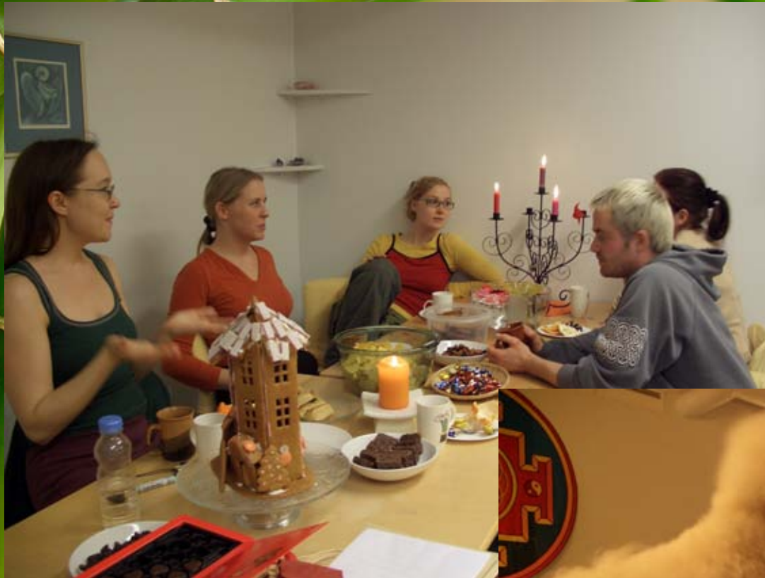
Kokoustamista joulun alla 2005