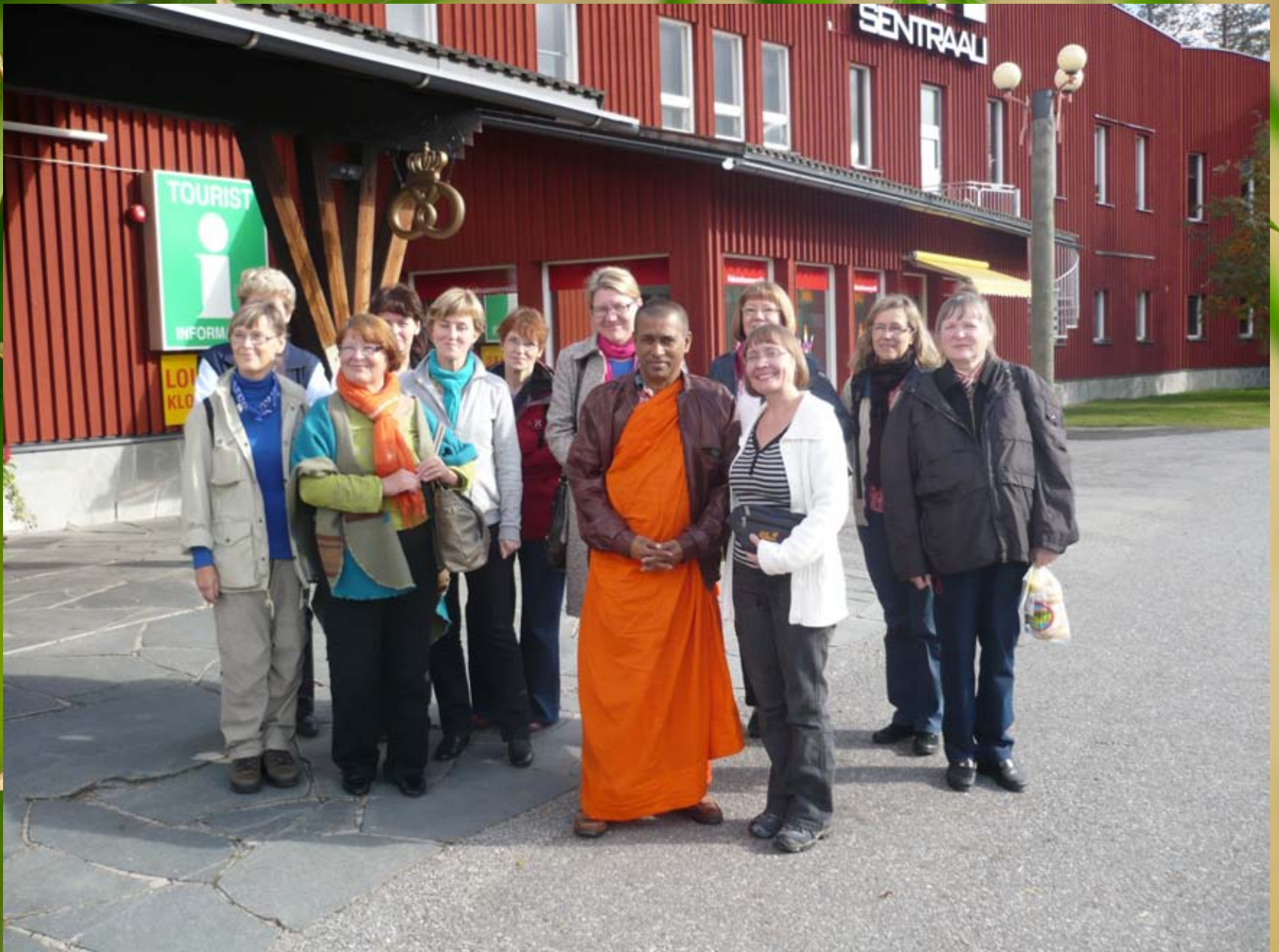
Reikiretki Kuusamoon 2010