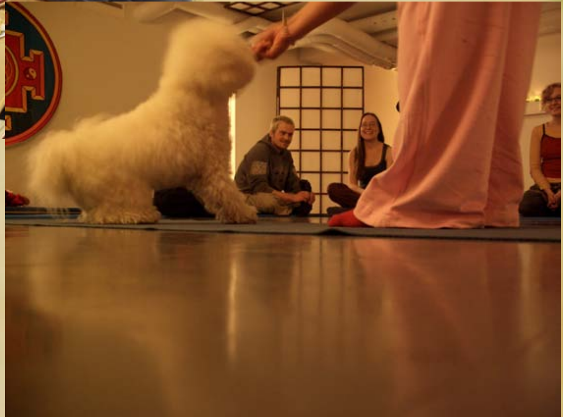
Koiratanssiesitys Pikkujouluissa 2005