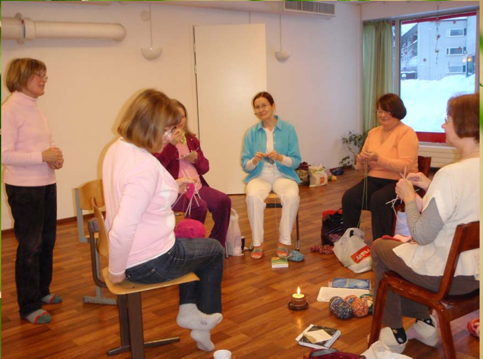
Neulepiiri vuosimallia 2008