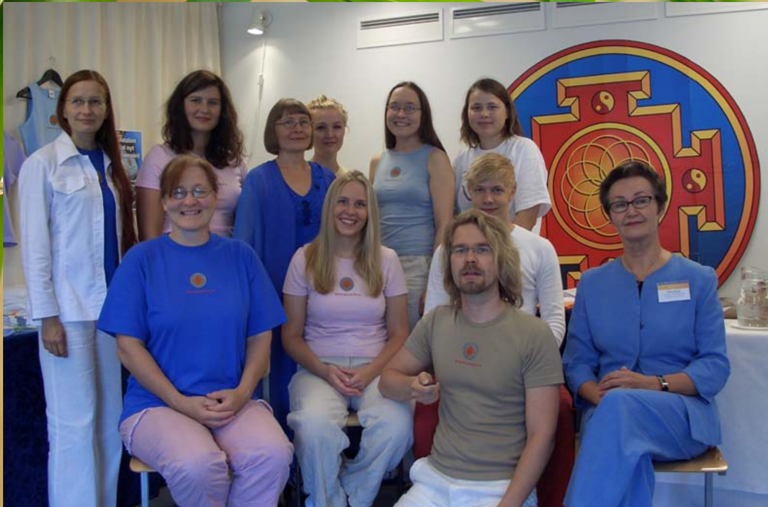
Ryhmäkuva vuodelta 2005