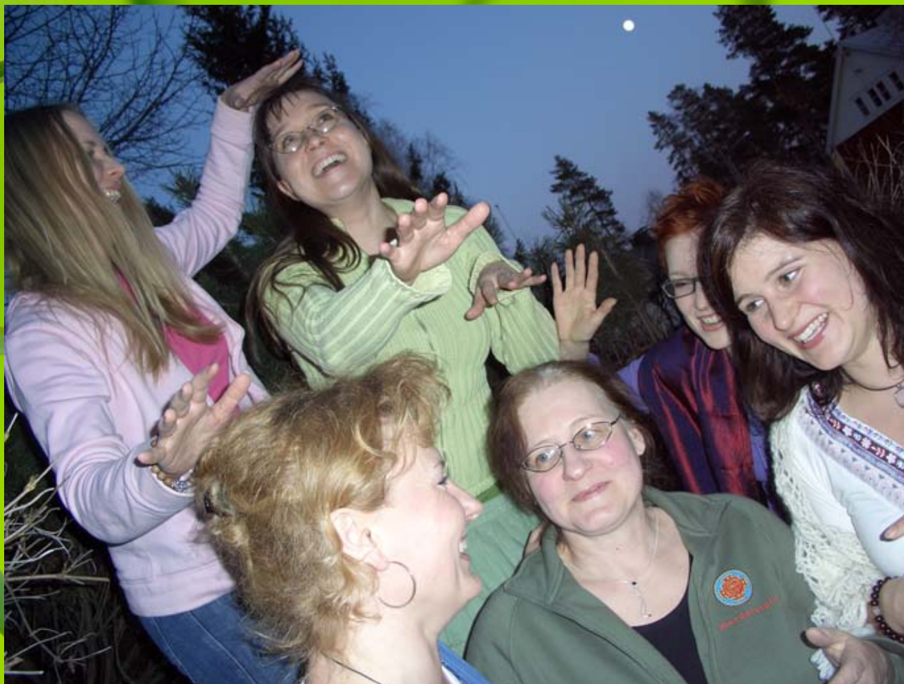
Naiset matkalla Yläkaupungin Yöhön 2007